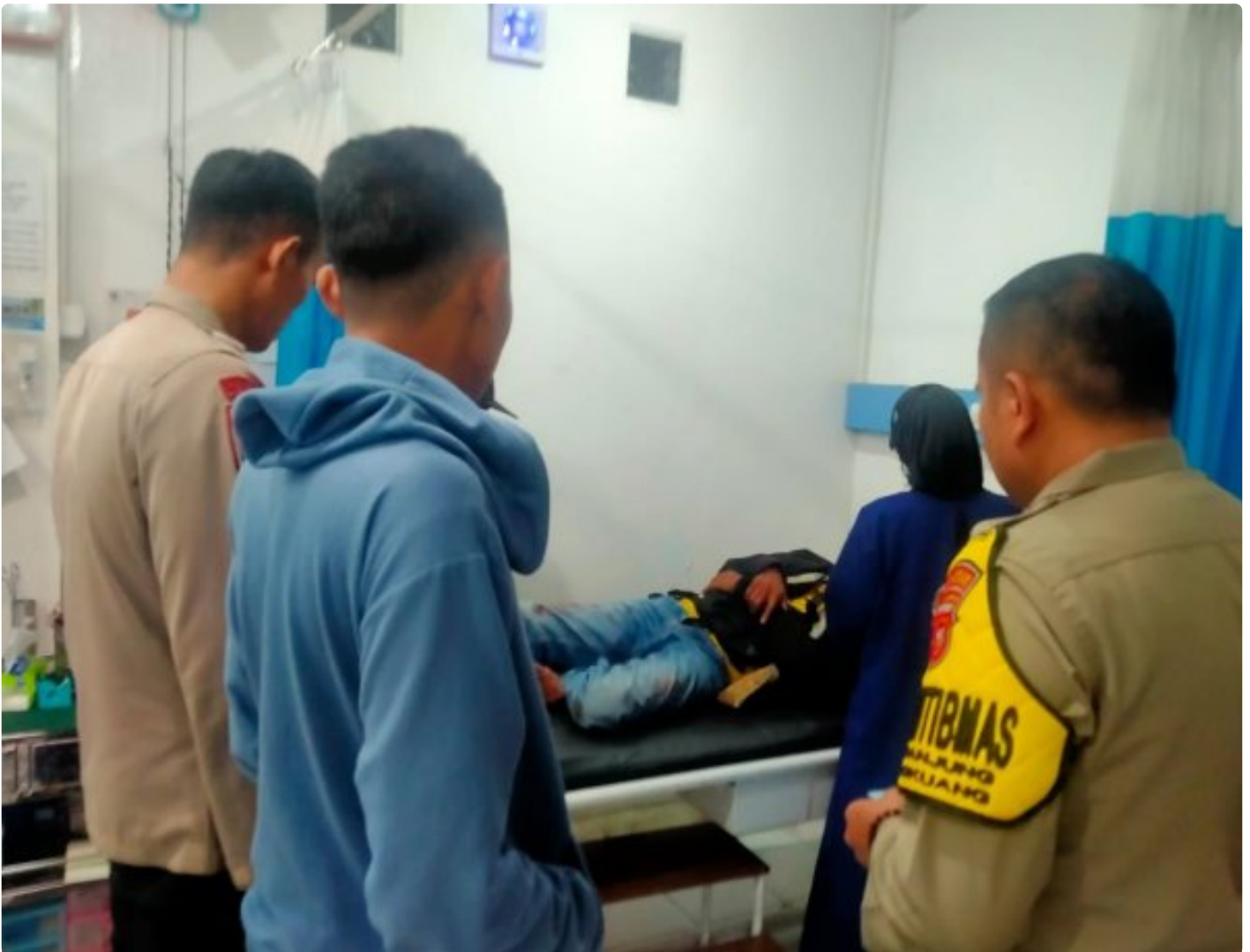
Dok. Giat Polsek Cangkuang (31/3/24)

CANGKUANG - Quick Respon Piket Fungsi Polsek Cangkuang Polresta Bandung, berikan pertolongan kepada korban kecelakaan tunggal di Jl Soreang Banjaran Desa Cangkuang, Minggu, (31/3) Pagi.